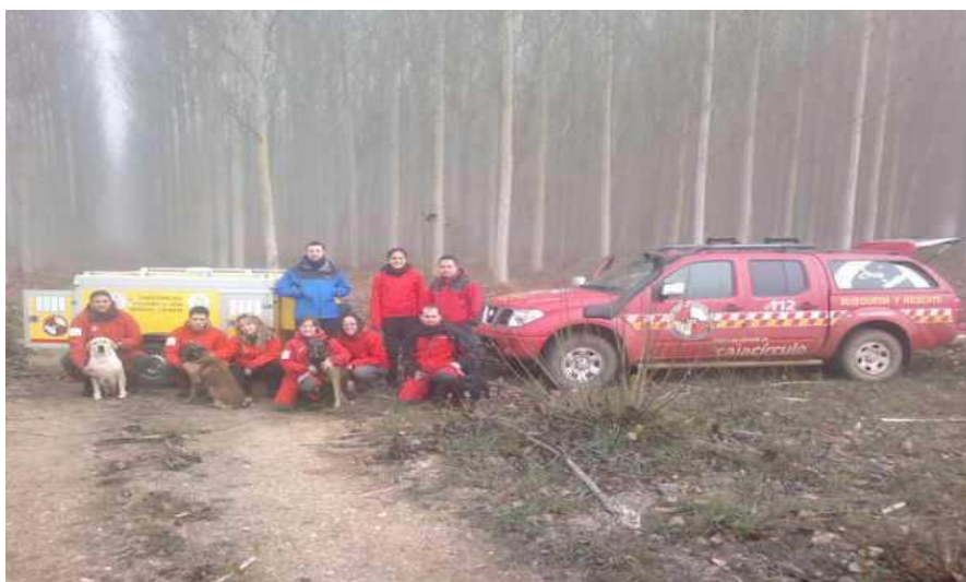
Equipo de Búsqueda que participo en las operaciones de Búsqueda

A esta búsqueda dedicamos todos nuestros medios, materiales, humanos y caninos disponibles. Hasta sumar un total de 16 personas y un total de siete perros. Tres vehículos movilizados, remolques, etc.