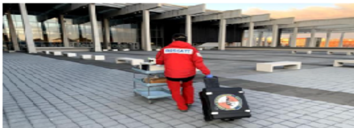
El GREM ha compartido material con el Hospital de Burgos.

Han cedido sus equipos de electromedicina y sus medios sanitarios para completar seis puestos de UCI en el Hospital de Burgos y reforzar el hospital de contingencia de Valladolid