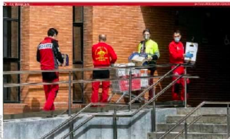
Respuesta masiva ante las necesidades sanitarias

Nuestro mundo está cambiando a una velocidad vertiginosa y es que, en un tiempo que a nivel mundial se están tomando medidas para hacer frente a la crisis sanitaria, nosotros en España estamos viviendo una situación de emergencia sanitaria. En este momento, la radio y la televisión son los canales de comunicación más importantes. Los medios de comunicación son los que nos permiten estar al tanto de lo que está pasando y de las medidas que se están tomando. En este momento, la radio y la televisión son los canales de comunicación más importantes. Los medios de comunicación son los que nos permiten estar al tanto de lo que está pasando y de las medidas que se están tomando.